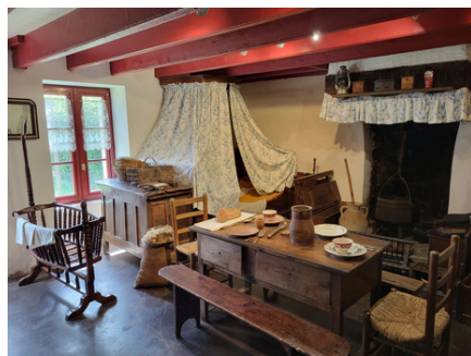
Chaumière Briéronne © Parc naturel © Escal'Atlantic - Farid Makhoul L'humière régional de Brière