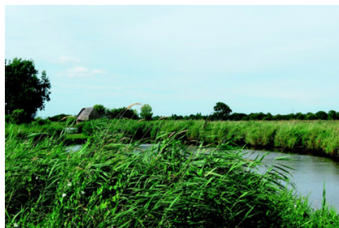
Réserve Pierre Constant