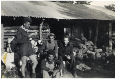
Groupe de maquisards devant une baraque aux Carteaux à Autrans