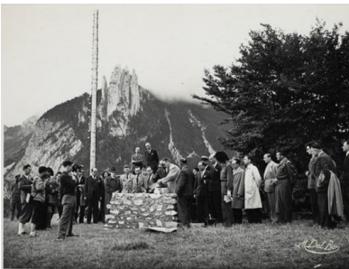
Pose de la première pierre de la nécropole du cimetière de Saint-Nizier