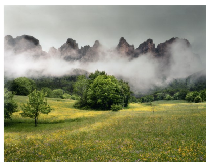
Vue de la « muraille » du Vercors, 2008, Roberto Neumiller, coll. Musée de la Résistance et de la Déportation - Département de l'Isère

La Course de la Résistance, organisée par le Département de l'Isère, revient pour une 8 e édition ! Initié par le Musée de la Résistance et de la Déportation de l'Isère, cet événement sportif et culturel rappelle le sens historique de la date du 8 mai, jour de la capitulation sans condition de l'Allemagne nazie en 1945. Cette année, la Course s'arrête dans le Vercors les 7 et 8 mai 2022 !