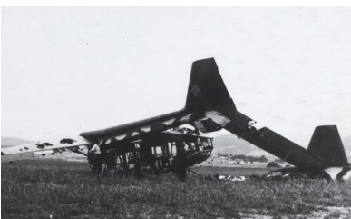
Carcasse d'un planeur allemand après l'attaque sur Vassieux-en-Vercors, coll. Musée de la Résistance et de la Déportation - Département de l'Isère