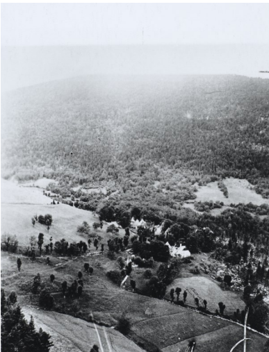
Ruines de Valchevière