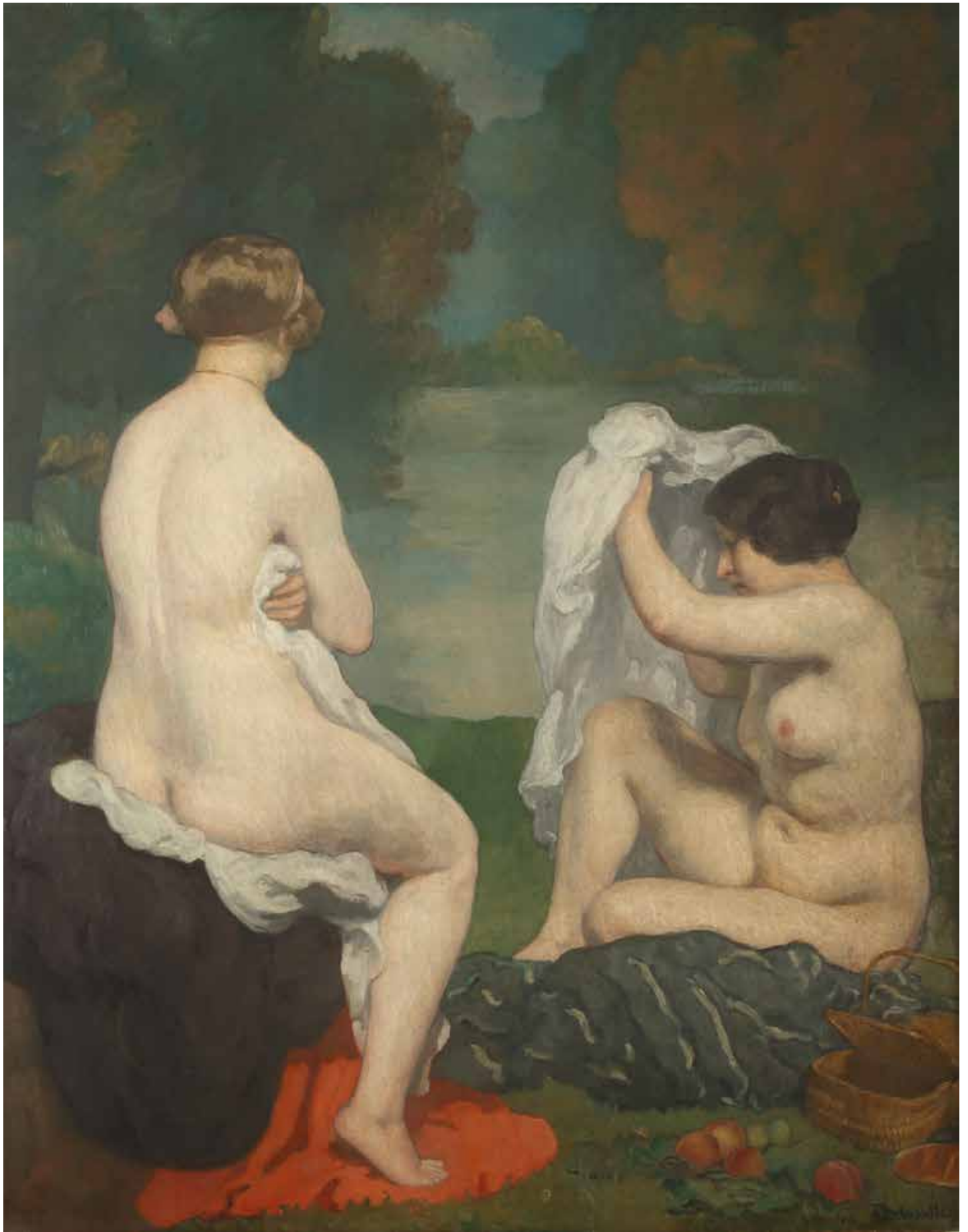
Angèle Delasalle , Les Baigneuses , huile sur toile, 130 x 162 cm, 1913, coll. MBJ