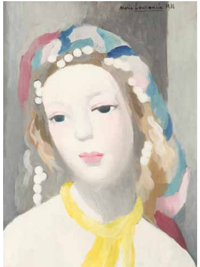
Marie Laurencin , Armande , Huile sur toile 1936, coll. MBJ