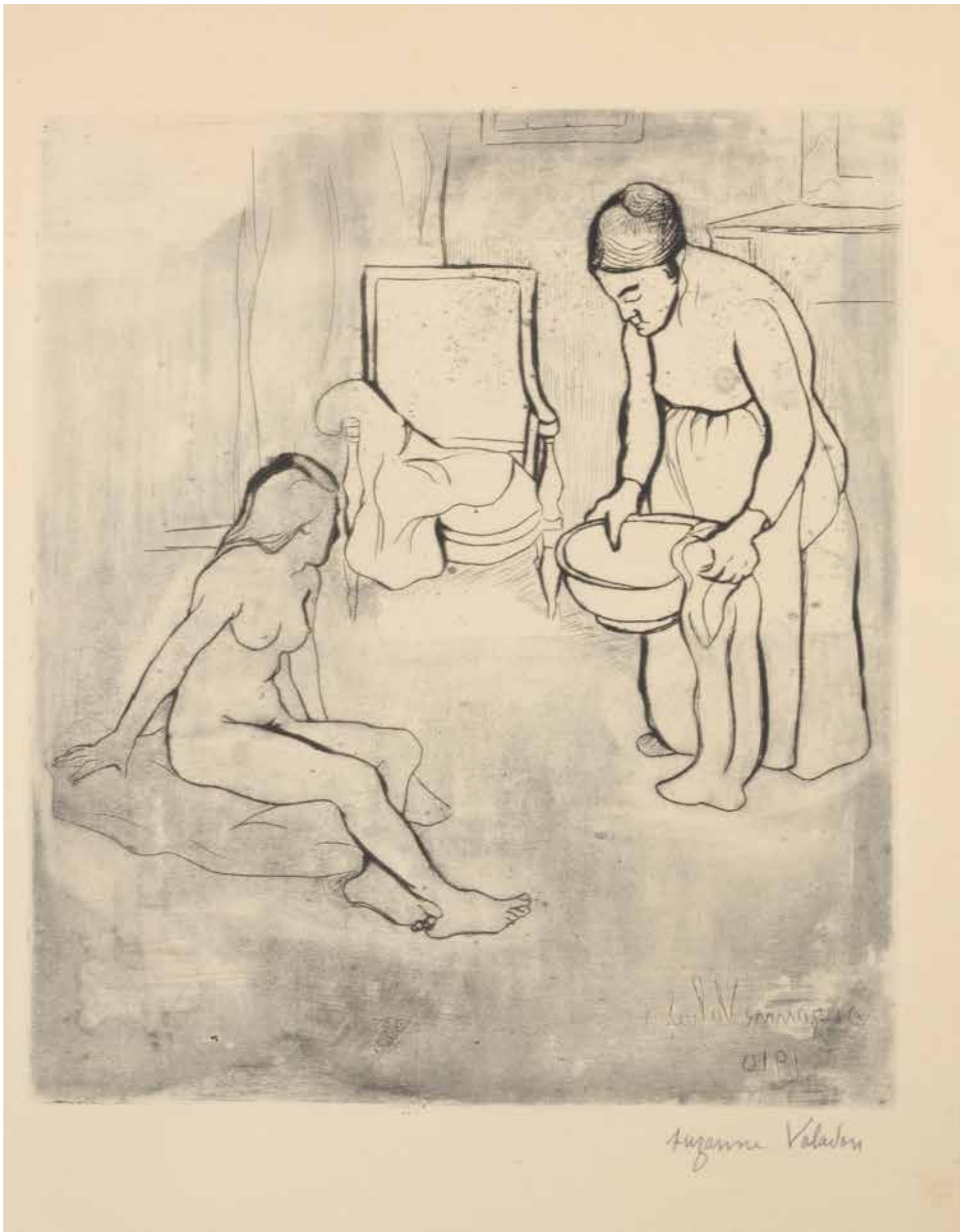
Suzanne Valadon , La toilette d'une jeune fille , Contre-épreuve d'une eau-forte à la pointe sèche sur papier, 27,5 x 23,5 cm, 1910, coll. MBJ