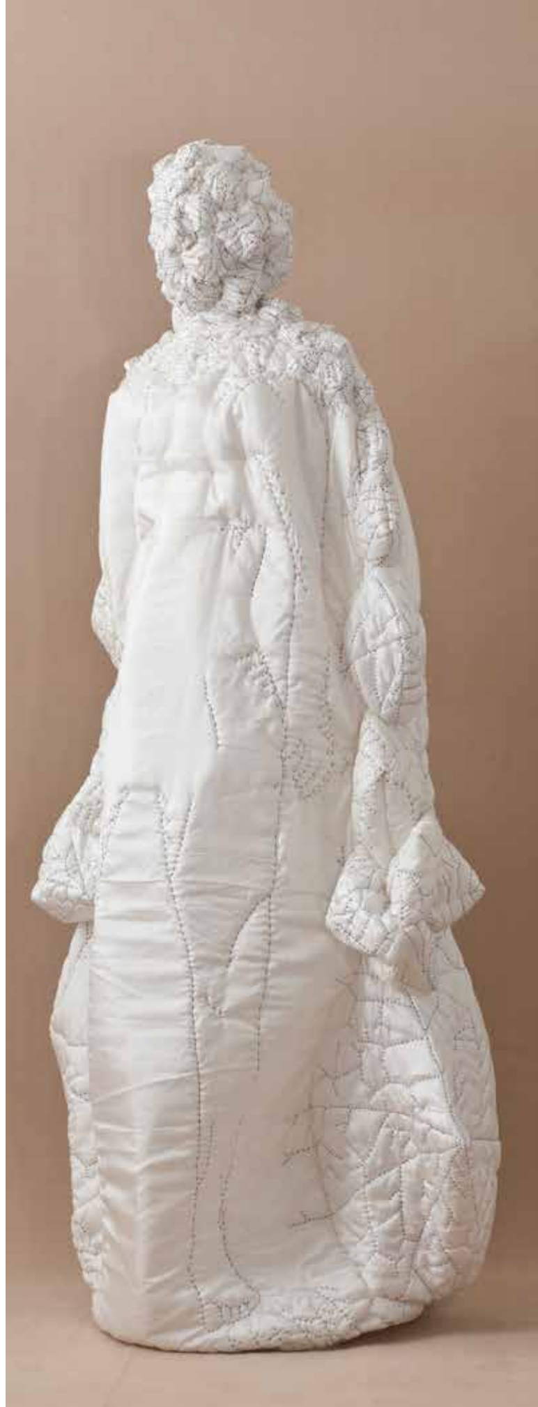
Sophie Menuet, Coquille , Ouate, coton doublé de soie, piqûres et surpiqûres noires sur support polystyrène 2012, coll. MBJ