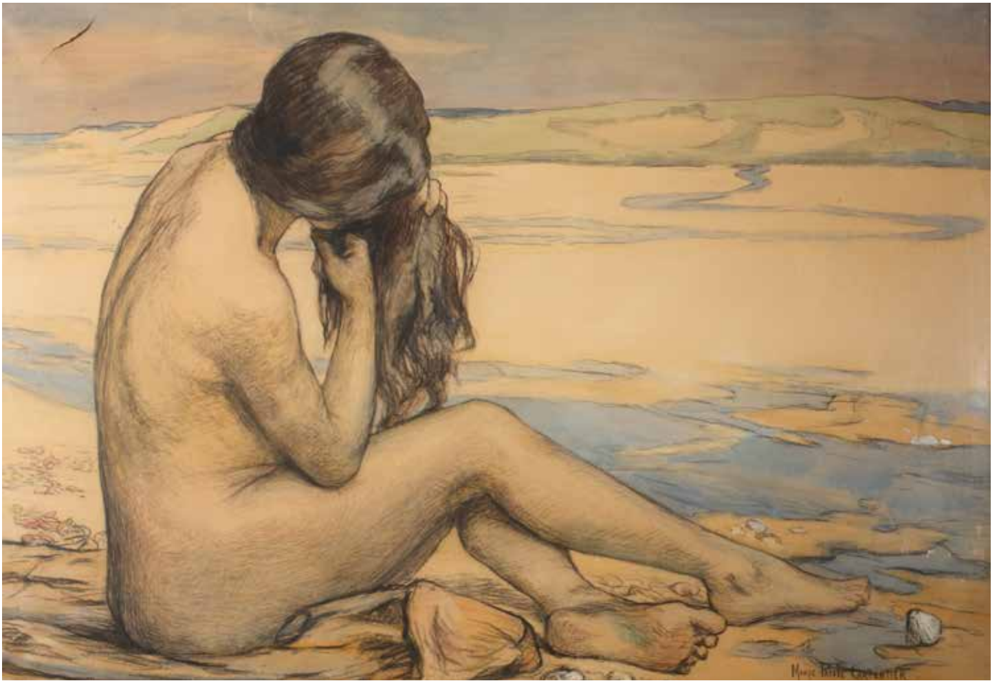
Marie-Paule Carpentier , Femme à la chevelure , Fusain avec rehauts Non daté (XIX e - XX e s.), coll. MBJ