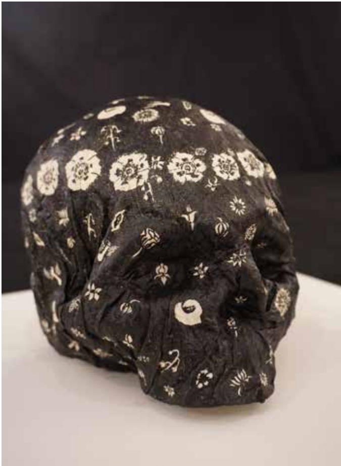
Danielle Stéphane , Vanité 1 (ou Hildegarde) , Toile moulée et durcie à la colle de peau, peinture à l'encre de Chine 2009, coll. MBJ