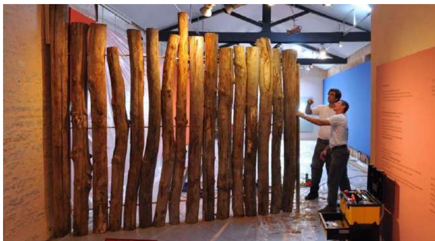
Vue du montage de l'exposition « À la côte ! »

Accéder aux compte-rendu et supports de présentation