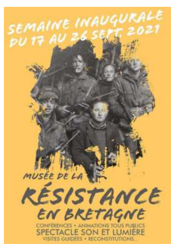
Affiche de la semaine inaugurale

Il y a 76 ans, la France et le monde sortaient d'un grand confinement : Confinement des esprits et des consciences écrasés sous la botte nazie ou complices d'une idéologie totalitaire et barbare ; confinement des corps contraints et martyrisés ; confinement de la dignité humaine et de la compassion, disparues dans la nuit et le brouillard des camps de la mort.