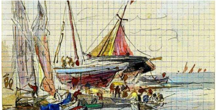
Cotres échoués et personnages débarquant, aquarelle de Louis-Marie Faudacq Collection musée d'art et d'histoire - ville de Saint-Brieuc

Bretagne musées souhaite aborder la thématique de l'ouverture des contenus culturels afin de favoriser celle-ci dans les musées de la région. Une première journée d'étude sur le sujet est prévue le 15 novembre au Musée de Bretagne, à Rennes . Celle-ci mêlera ateliers de mise en situation dans le rôle d'usagers, point juridique quant aux licences ou enjeux liés aux images et état des lieux de l'ouverture des contenus dans les institutions culturelles. Nous vous invitons à noter cette date et reviendrons vers vous à la rentrée pour les inscriptions.