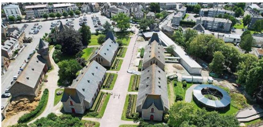
Vue aérienne du chantier (en haut à droite)