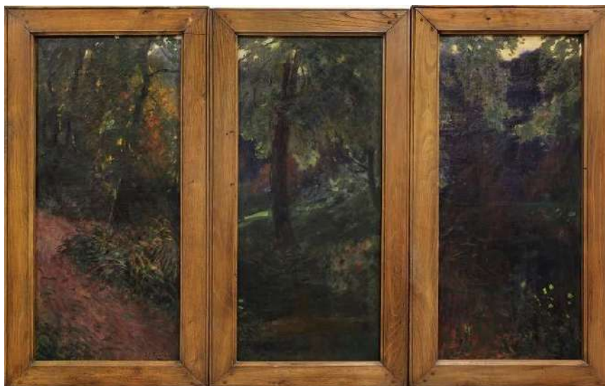
Triptyque - Frank Penfold - Huile sur panneau - vers 1880 - Musée de Pont-Aven

Accéder aux compte-rendu et supports de présentation