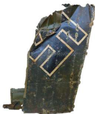
Débris d'empennage frappé de la croix gammée provenant d'un avion de la Luftwaffe, remonté dans les filets d'un pêcheur au large de Lorient, Don Robert, 1994.