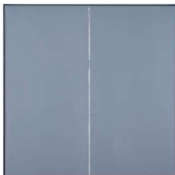
Rupture, huile sur toile, 1986, Musées des beaux-arts de Vannes