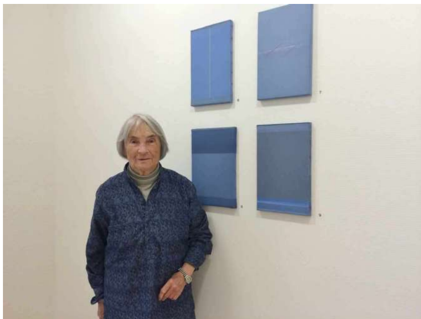
Geneviève Asse à la Galerie Oniris à Rennes en 2014

L'artiste peintre et graveuse Geneviève Asse est décédée à Paris le 11 août dernier à l'âge de 98 ans. Figure importante de l'art contemporain elle était notamment connue pour son travail pictural autour de la couleur bleue. Un bleu multiple qui s'inspire notamment des paysages de son enfance, du ciel et de la mer sans cesse renouvelés du Morbihan, où elle revient s'installer en 1987, sur l'île aux Moines, pour peindre. En 2013, suite à une donation de l'artiste, la Cohue, musées des beaux-arts de Vannes, avait ouvert un important espace consacré à son œuvre au premier étage du musée.