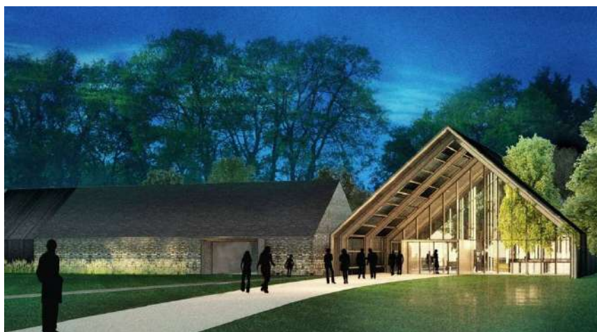
Prévisualisation du futur musée