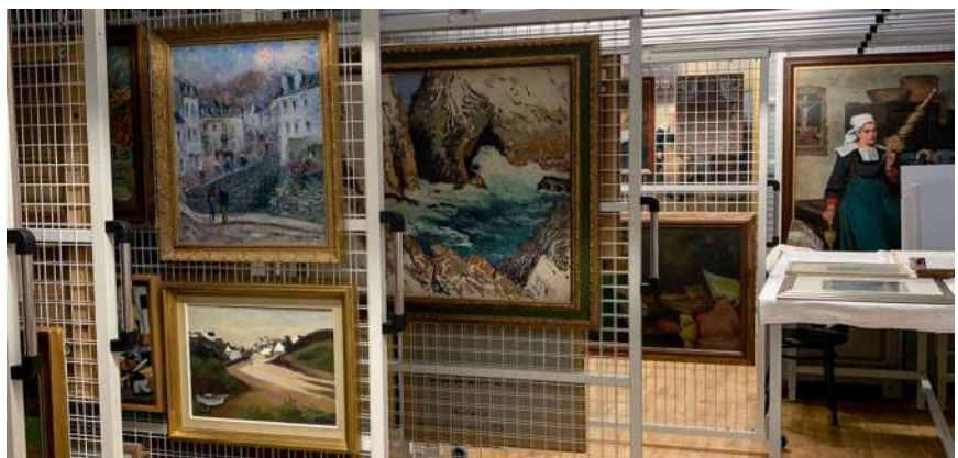
Exposition Sorti.e.s de réserves, au musée d'art et d'histoire de Saint-Brieuc, en 2018

Comment aménager et réorganiser des réserves ? Comment permettre une ouverture plus importante de celles-ci aux publics ? Comment concilier impératifs de conservation et de médiation ? Cette journée abordait des sujets divers à propos des réserves, le fil conducteur de la journée étant de questionner le rôle des réserves, leur vocation au sein du musée, entre missions de conservation et de médiation.