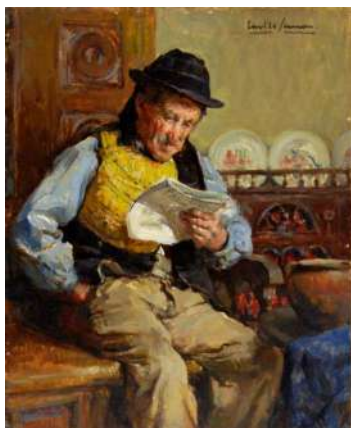
Breton à la lecture, huile sur toile, Emile Simon, musée départemental breton